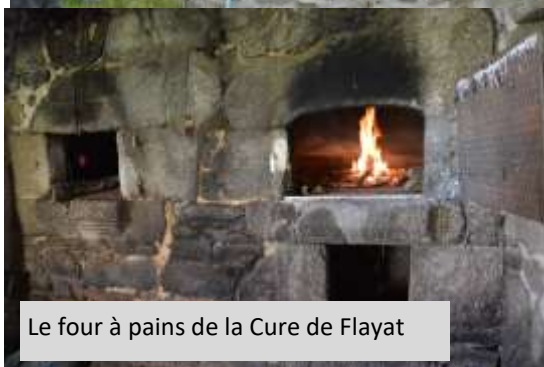
Le four à pains de la Cure de Flayat