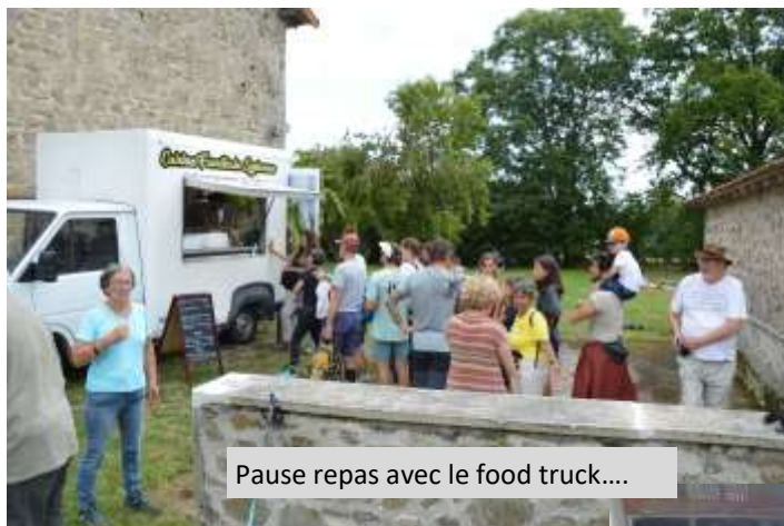
Pause repas avec le food truck....