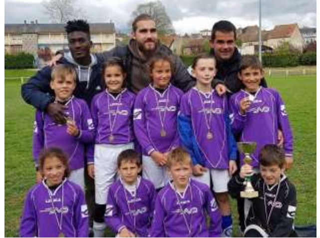
2ème place Challenge Camille Merot

Les U15 sont à la troisième place sur 4.