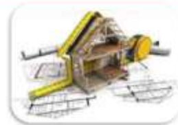
ARTISANAT DU BÂTIMENT

Vous réfléchissez à des investissements en termes d'aménagement immobilier léger, sur des investissements numériques, des investissements productifs (matériels), ou encore sur des questions de transition énergétique,