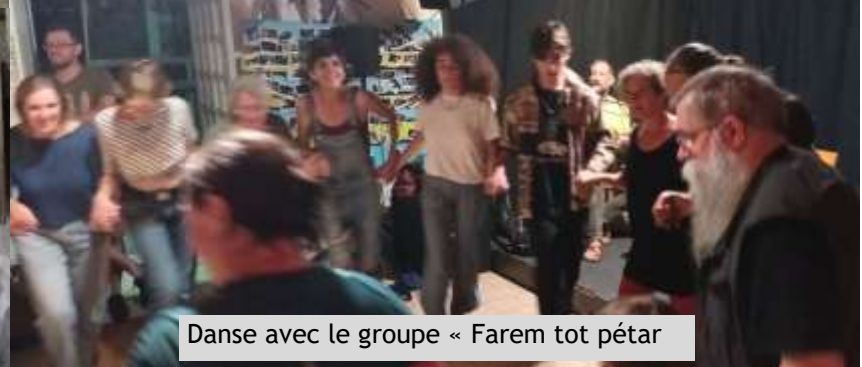
Danse avec le groupe « Farem tot pétar »

Courant novembre, le conseil d'administration s'est inscrit dans un projet de DLA (Dispositif Local d'Accompagnement dans l'économie sociale et solidaire) pour :