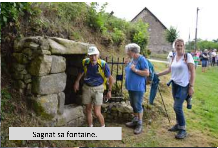
Sagnat sa fontaine.